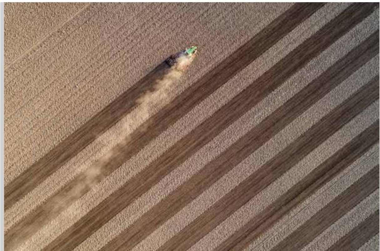
Csák István: Vonalak