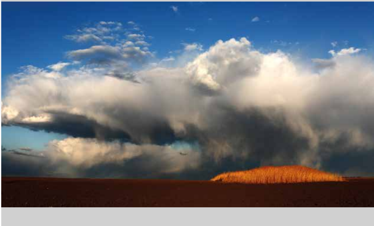
Palcsek István: Áprilisi zivatar