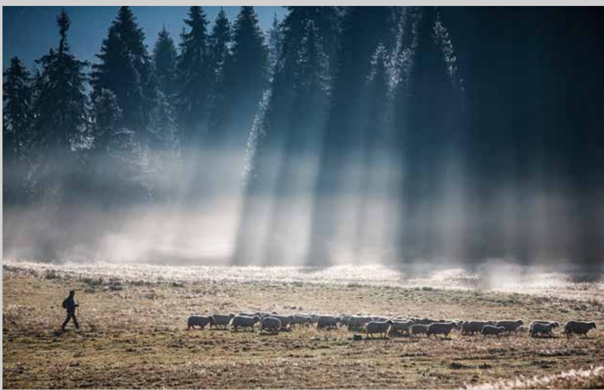
Palcsek István: Hazafelé