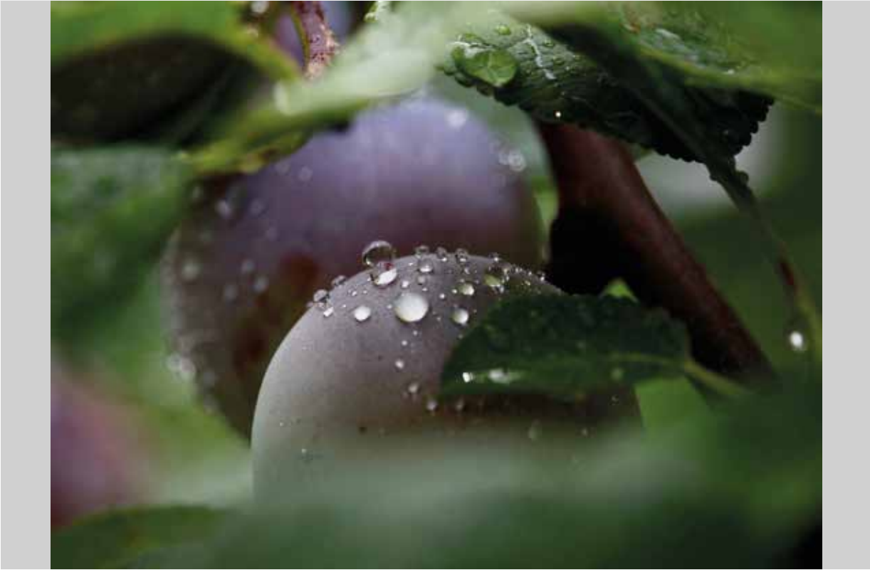
Pécs Klaudia: Harmat