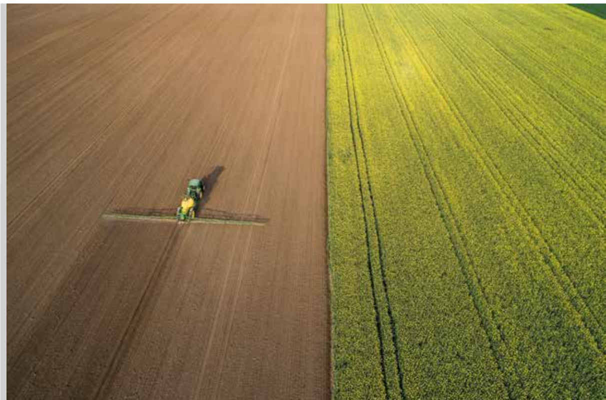
Csak Istvan: Szimmetria