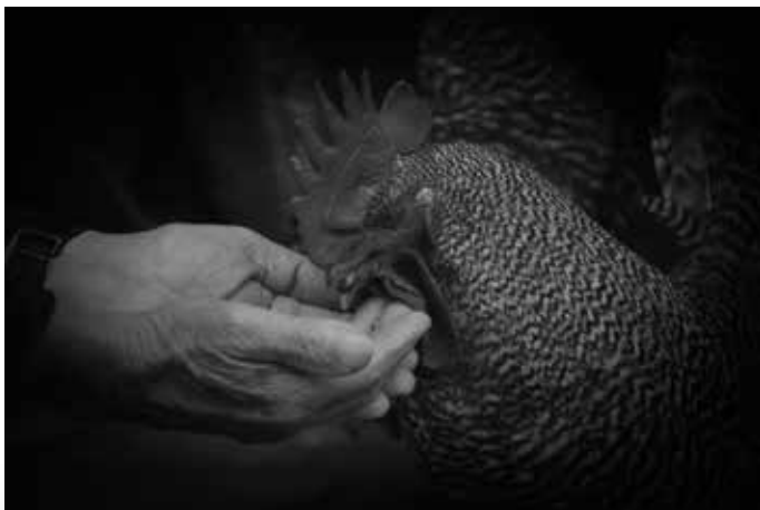
Életet adó étel