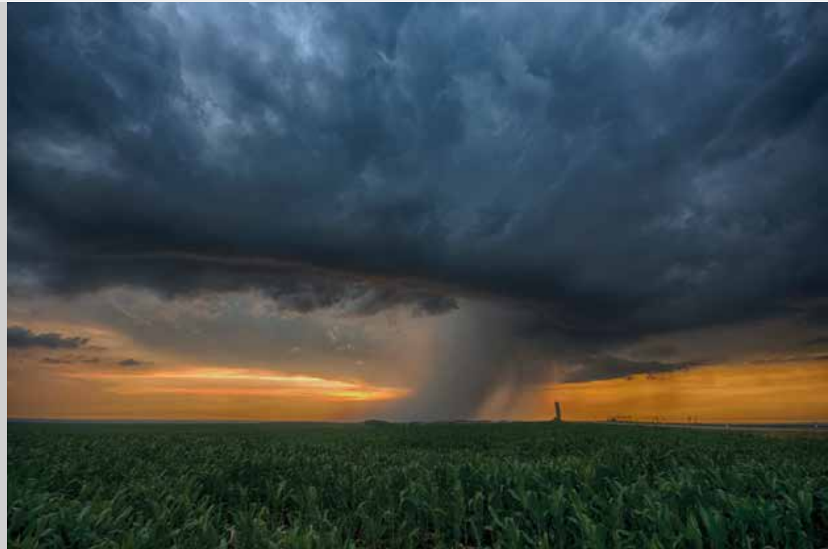
Kovács Krisztián: Tengeri vihar