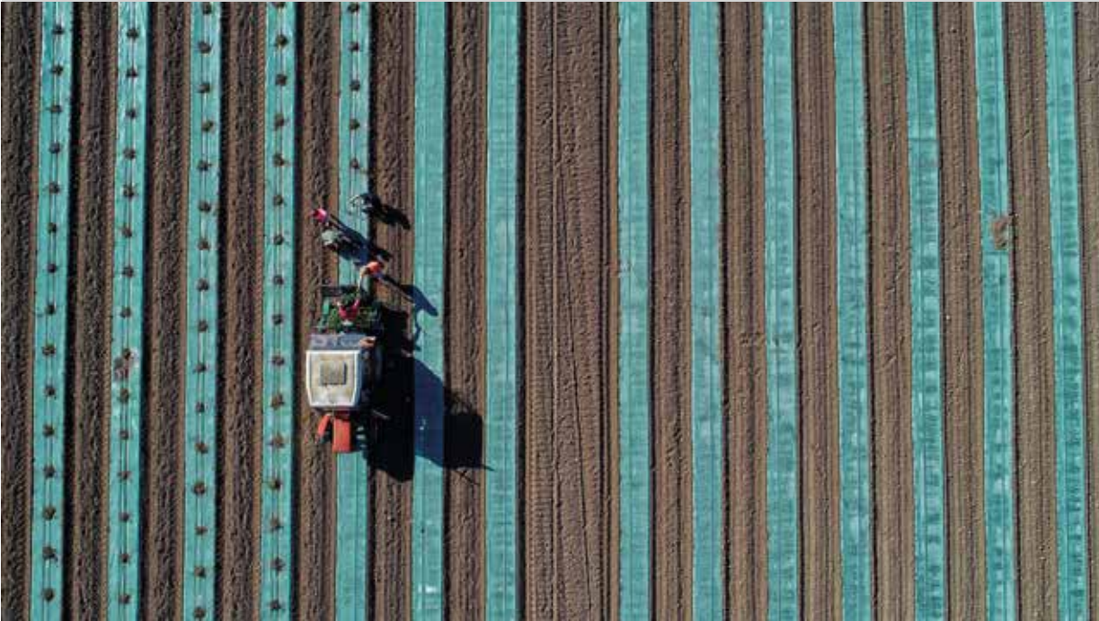
Böröczky Bulcsú: Mértani pontossággal