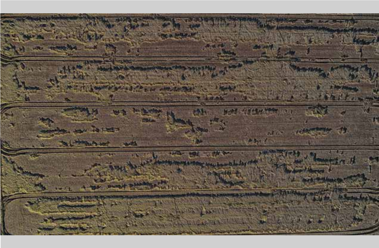
Böröczky Bulcsú: Ember tervez...