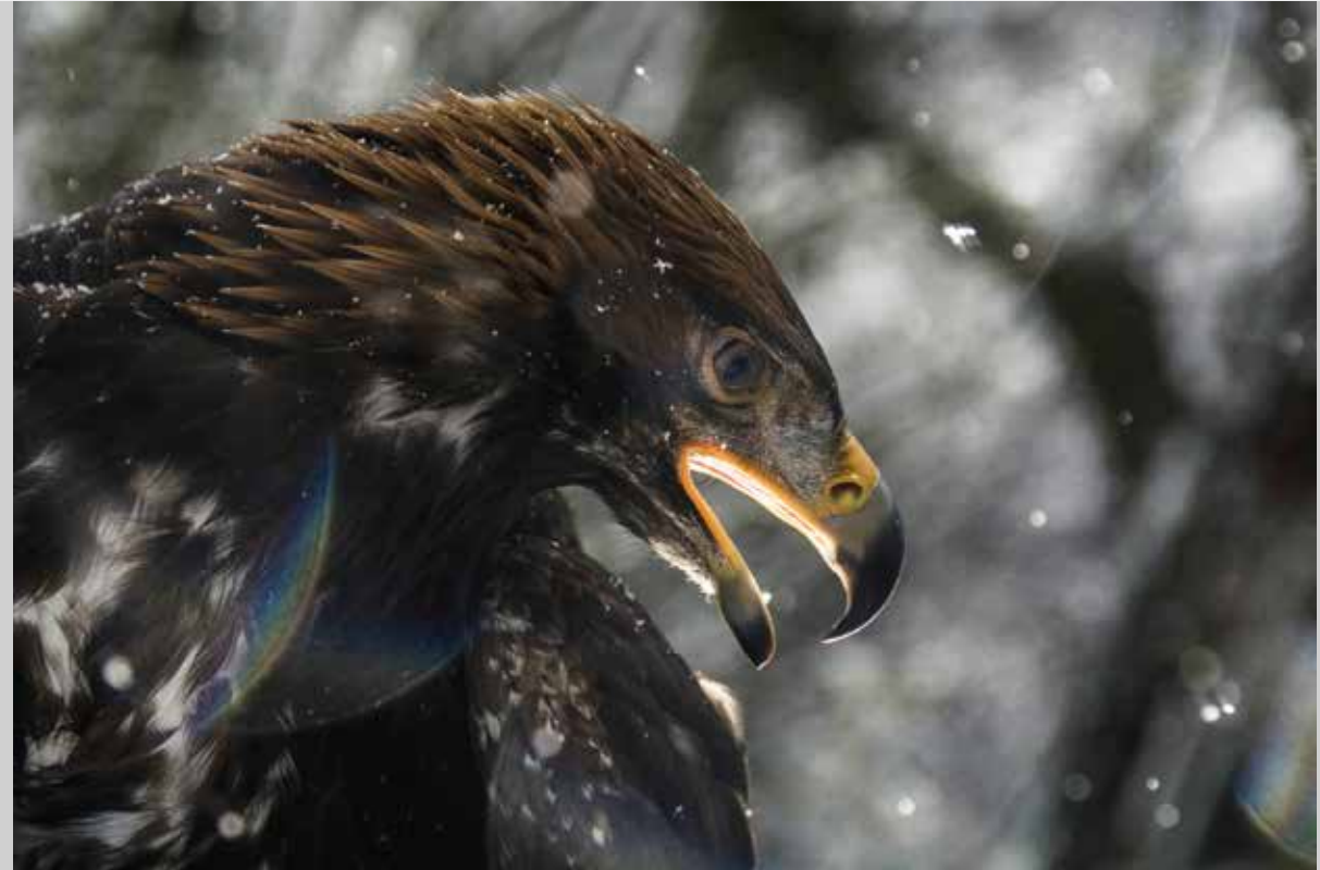
Görögh Zoltán: Az őrszem