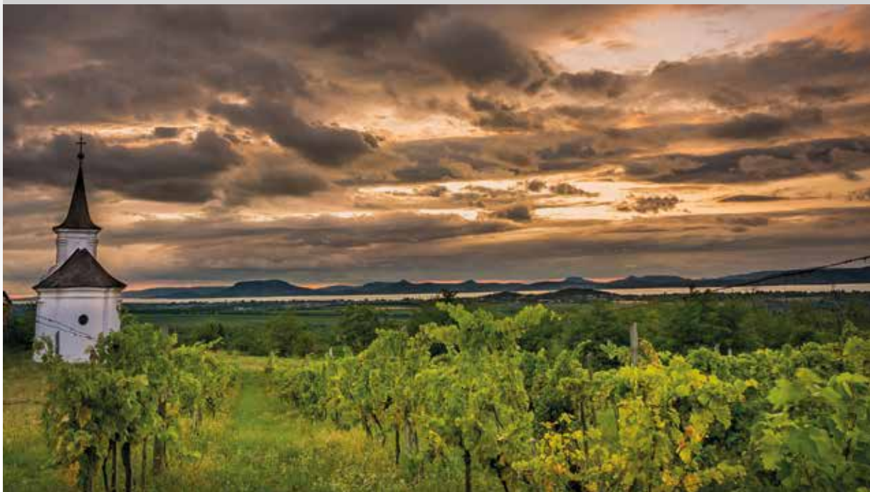
Stadler István: Szüretre várva