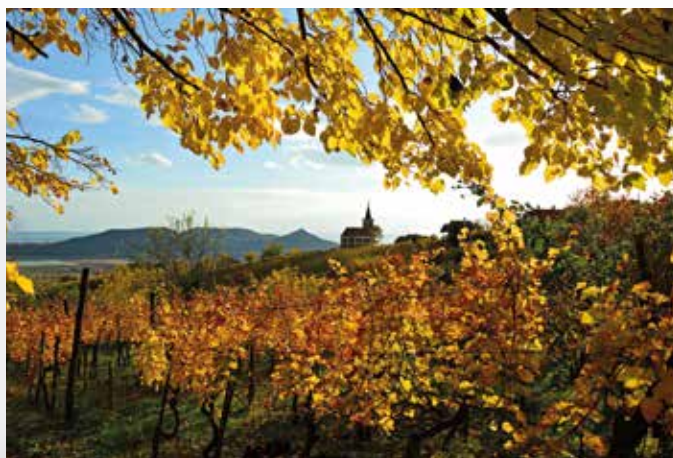
Ősz a Szent György-hegyi szőlőben