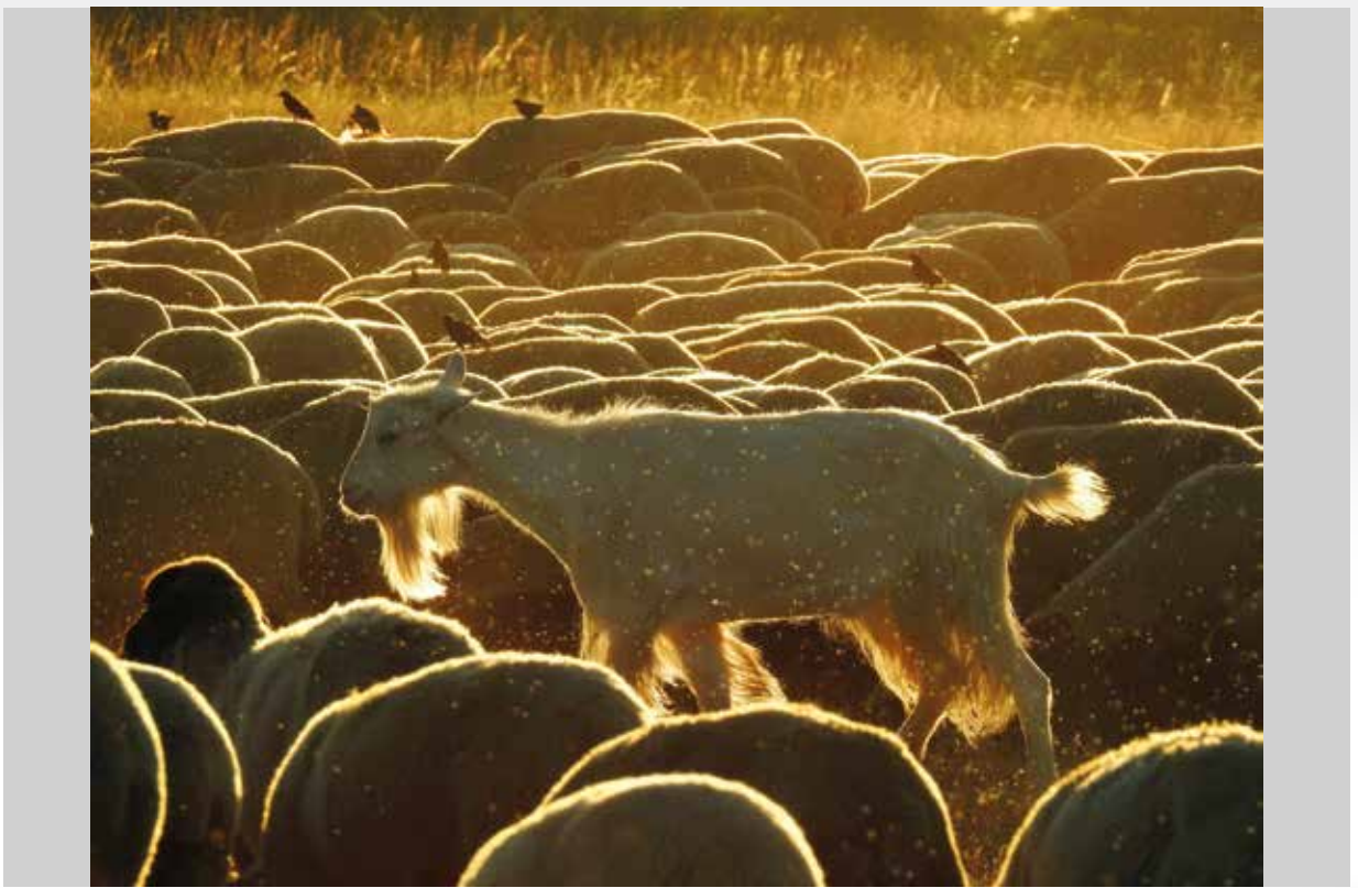
Koncz-Bisztricz Tamás: Kakukk kecske